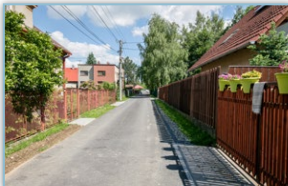
Oprava učelové komunikace u Nošovic