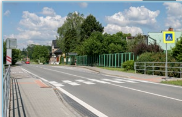
Přechod pro chodce na špici