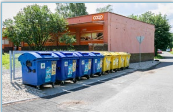
Uprava stanovišť kontejnerů