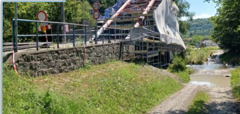
Oprava mostu přes řeku Morávku