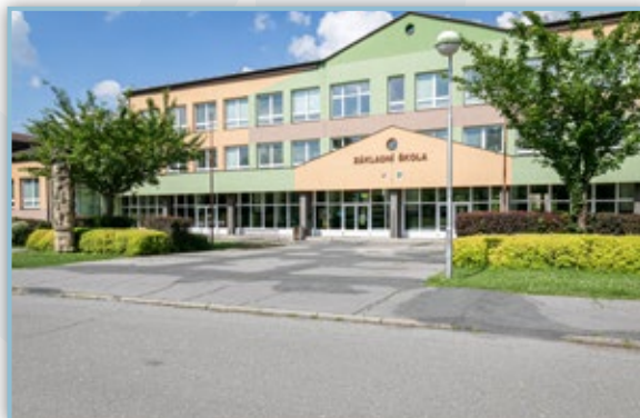
Vstupní plochy před ZŠ