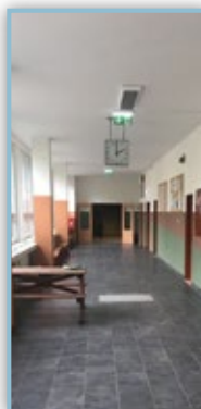
Investiční plán ZŠ 2021