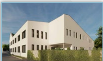
Obecní dům zadní pohled