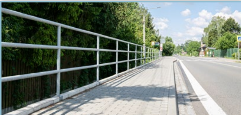
Chodník od zastávek na špici