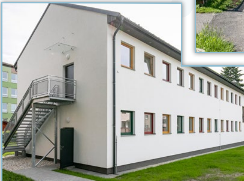
Nový pavilón Mateřské školy