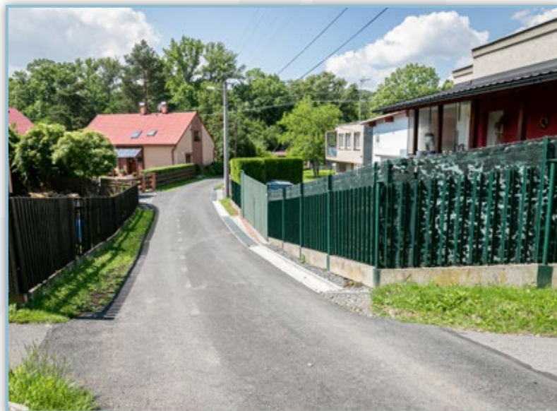
Oprava učelové komunikace u Nošovic