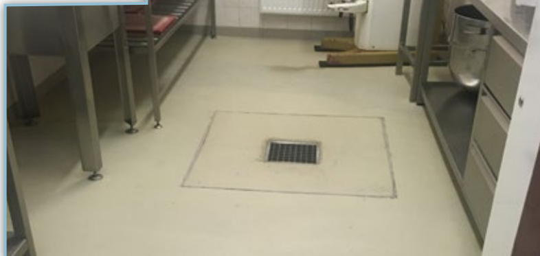
Oprava těsnosti podlah ve školní kuchyni