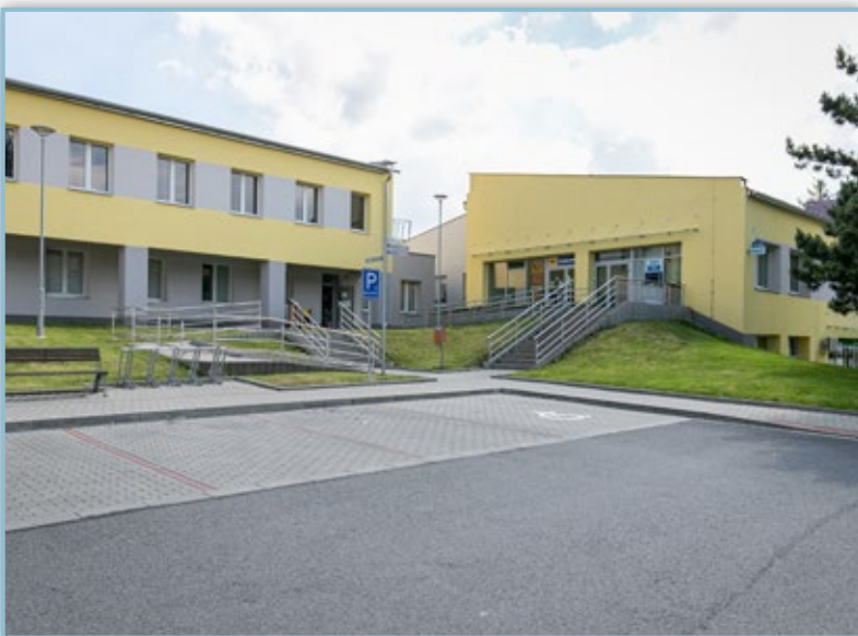
Zateplení obecního úřadu budova IDS