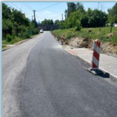
Rozšíření křižovatky za mostem Přes dálnici