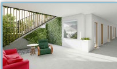
Obecní dům interiér