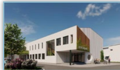
Obecní dům - průčelí