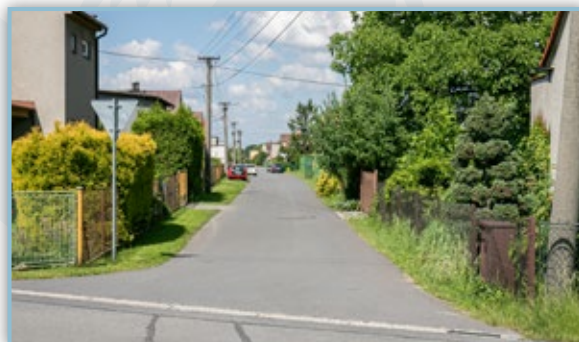
Oprava místní komunikace za multifunkčním hřištěm