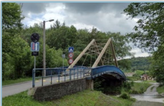
Oprava mostu přes řeku Morávku