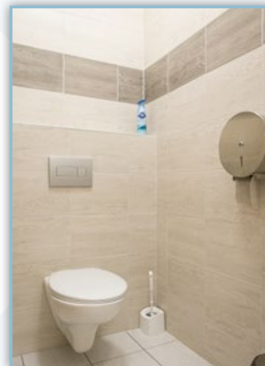
Rekonstrukce zdravotnický obřadní síň OÚ