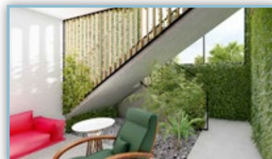
Obecní dům iteriér