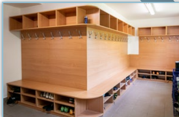
Oprava šaten na Spartě