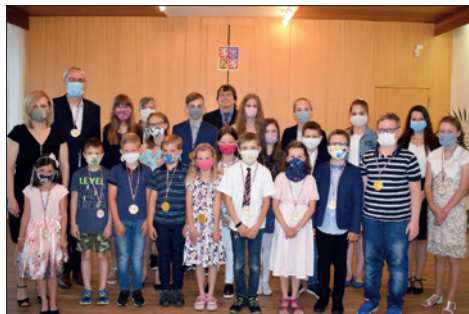
Přijetí oceněných žáků za školní rok 2019/2020