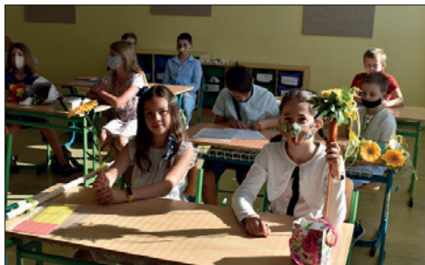
Společné setkání po téměř 4 měsících