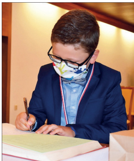
Podpis do pamětní knihy obce