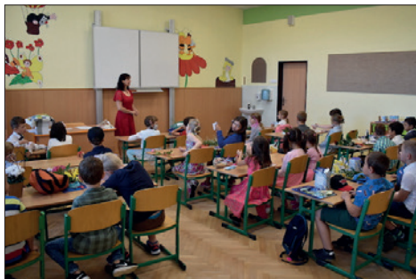
První vysvědčení pro prvňáčky