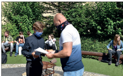
Předávání vysvědčení ve školním atriu