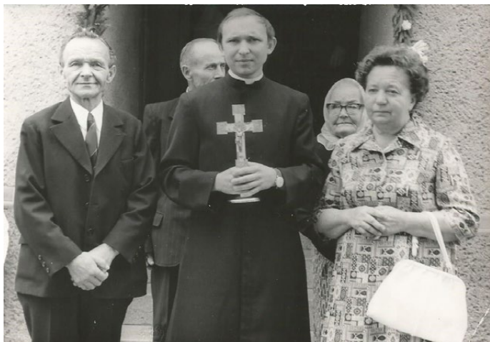
U rodného domu před primiční mší s rodiči Gacikovými a prarodiči Danysovými

Po roce 1968, kdy nás obsadili Rusové, začala tzv. normalizace. Znal jsem už v té době salesiány, tak jsem se domluvil s představenými, že se zkusím přihlásit do kněžského semináře v Litoměřicích. Tehdy ale většina spolubratrů salesiánů studovala tajně. Legrace byla při mém přijímacím pohovoru na fakultu, protože pan děkan si myslel, že mám v papírech chybu. Nechápal, že jsem za šest let stihnul učňák, vojnu, práci i gympl. Další přísedící si to spočítal na prstech a řekl mu: „Je to v pořádku, pane kolego“.