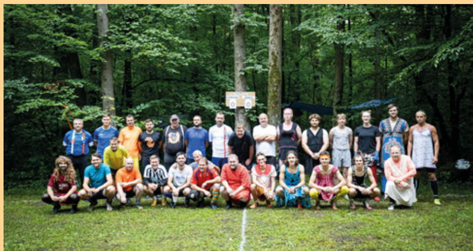
Svobodní - ženatí