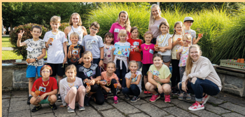
Knihovna - cesta kolem světa