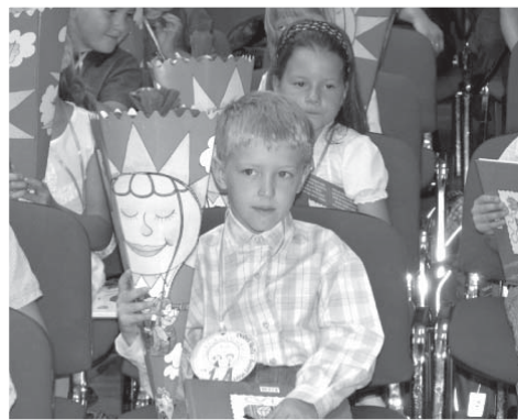
Jaká tajemství asi skrývá sluníčkový kornout?