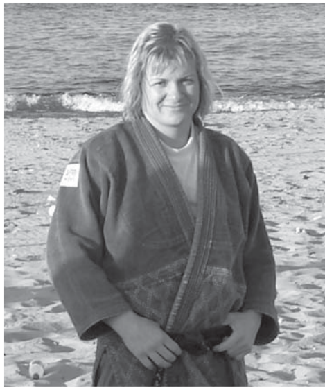
Judo je životní styl. Takže se trénuje vždy a všude.

Průllová je stále ve skvělé sportovní formě a když nechce brát iluze mladším soupeřkám na republikových soutěžích, tak si pro letošní rok nepořídila závodní licenci. Nabídka reprezentovat českou policii na mistrovství světa se však odmítnout nedala. Tak celé prázdniny tvrdě trénovala a v současné