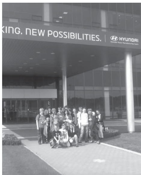
Doberští žáci před hlavní administrativní budovou automobilky Hyundai v Nošovicích.

Poté každý návštěvník obdržel reflexní vestu, ochranné brýle a sluchátka, která umožňovala sledovat výklad průvodkyně, a vyrazili jsme na zhruba hodinovou prohlídku celého provozu. Během exkurze jsme mohli nejen zblízka poznat moderní technické vybavení továrny, ale byli jsme i zasvěceni do promyšleného systému výroby a seznámili jsme se také s podmínkami práce zaměstnanců.