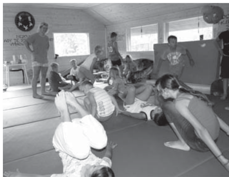
I nejmladší členové závodního týmu se v srpnu zúčastnili soustředění na Skalici.