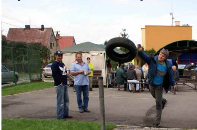
Fotografie z letošní Velké doberské 28. srpna 2010.

Chvilka spánku — i když jak pro koho, neboť Ochodničané zpívali a tančili, a to nepřeháním, od večera do nedělního rána! Po snídani jsme navštívili bohoslužbu v kostele sv. Jiří a hned přesun hudebních nástrojů a slovenských přátel zpět na hřiště, na místo konání netradiční olympiády mezi obcí Dobrá a obcí Ochodnica. Soutěže byly velice nestandardní, ale domnívám se, že mnohé by si zaslou-