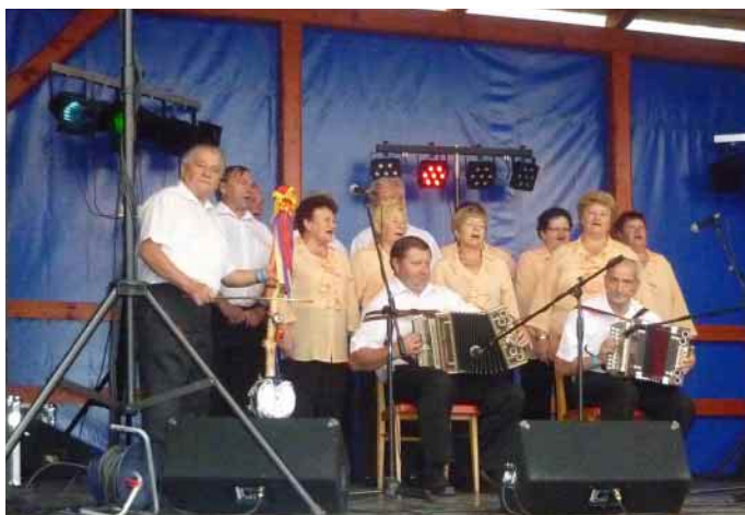
Fotografie ze soutěží a vystoupení hostů při letošní Velké do- berské 28. srpna 2010.