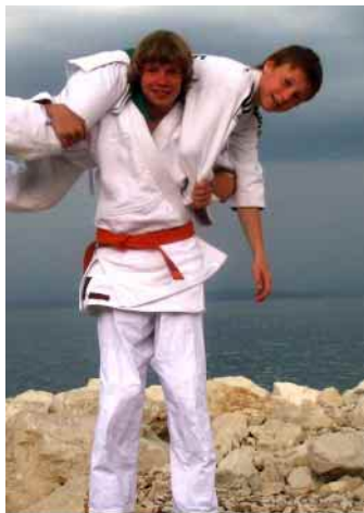
Judisté na Jadranu

LETNÍ KEMP MĚL VELKÝ ÚSPĚCH. Letního kempu v Dolní Lomné se v červenci zúčastnila padesátka dětí z Dobré a okolí. Nezapomenutelné zážitky si přivezli děti