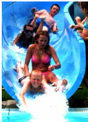
Po japonském obědě do skal a k vodě