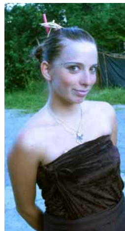
Arabské dívky, tibetský mnich, křovácká náčelnice a japonská gejša? Jen naši doberští