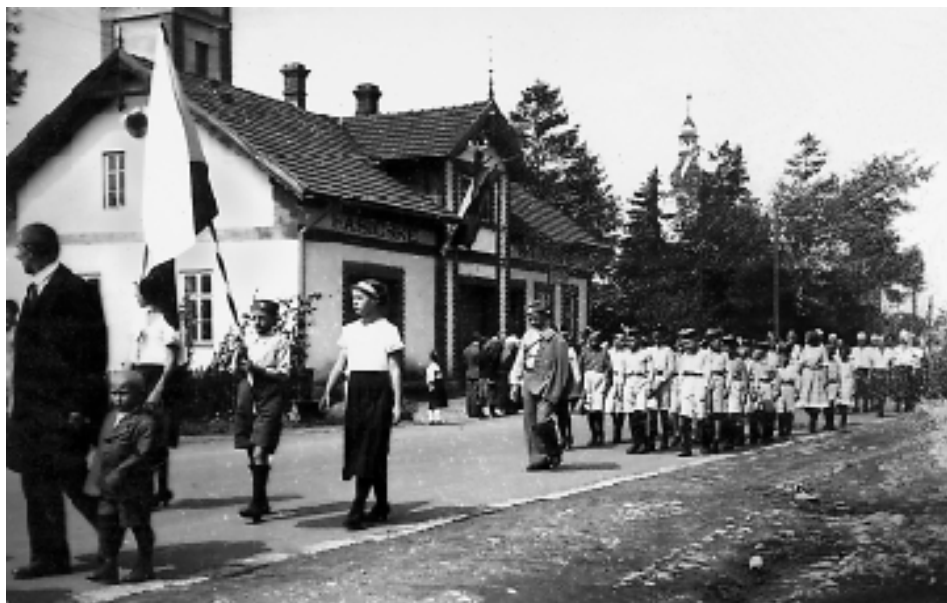
Poslední průvod Sokolů před hasičskou zbrojnicí 17. července 1938.