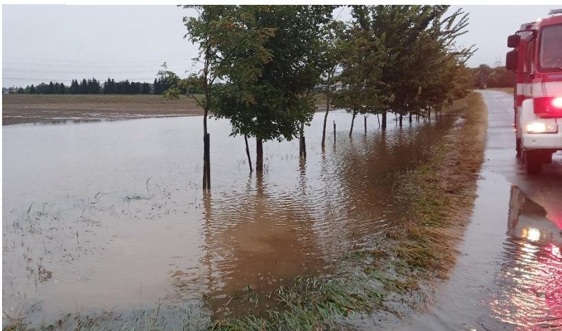
Ucpaný průchod pod silnicí vedle dálnice.