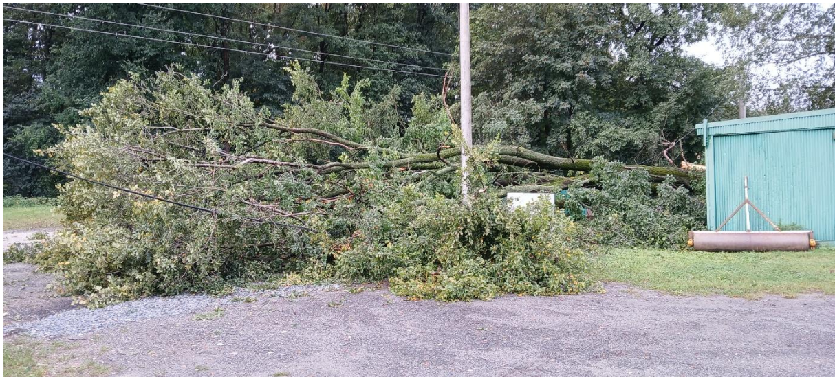
Vyvrácený strom na hřišti Sparta.