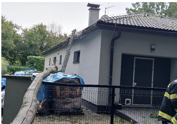
Strom na rodinném domě v Horních Domaslavicích.

V neděli ráno v 7:27 jednotka opět vyjela, tentokrát spadl strom na rodinný dům v Horních Domaslavicích. Zároveň druhé družstvo vyjíždělo s dopravním automobilem Fiat k popadaným stromům v naší obci. Následovaly další události, které se řešily na území obce Dobrá. Jednotka se rozešla ve 14:06, čímž byla práce v Dobré ukončena. Další povolání přišlo ve 21:17 a jednotka vyrazila do Skalice, kde řešila 8 událostí spojených s čerpáním. Ve 22:54 byla jednotka povolána k čerpání do Frýdku-Místku, kde zasahovala v místní části známé jako Malý Koloredov. Na stanici