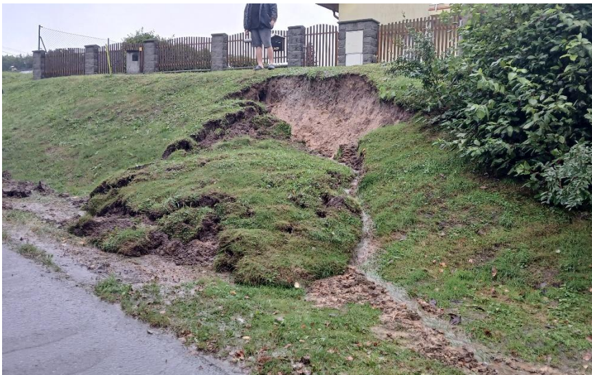
Urvaný svah ve Frýdku-Místku.

První zásah byl jednotce ohlášen v sobotu 14. 9. 2024 ve 12:55. Jednalo se o vzrostlý strom, který spadl do potoka v městské části Bahno-Příkopy. Rozsáhlá série zásahů začala později odpoledne. V 16:12 jednotka znovu vyrazila do Frýdku-Místku, kde se na ulici K lesu utrhł kus svahu. Následovalo čerpání zatopeného sklepa, stavba hrází, monitoring a následně další zatopené sklepy. Většina těchto zásahů byla v obci Dobrá. V nočních hodinách jednotka zasahovala u zatopených garáží ve Frýdku-Místku, kde z jedné garáže vyprošťovala veterána s dřevěnou karoserií. Celou sobotní sérii ukončila zatopená garáž ve Skalici. Jednotka se vrátila v neděli v jednu hodinu po půlnoci.