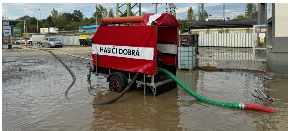
Čerpání vody ze zatopené Ostravy.

Ve čtvrtek jednotka odjela na celodenní čerpání do Ostravy. Do místní části Nová Ves vyjela 19. 9. 2024 v 6:45 a vrátila se krátce před 23. hodinou. V Ostravě vystřídala několik stanovišť, kde zároveň běžela 3 naše čerpadla. Byla to zároveň poslední událost v operačním řízení během těchto povodní.