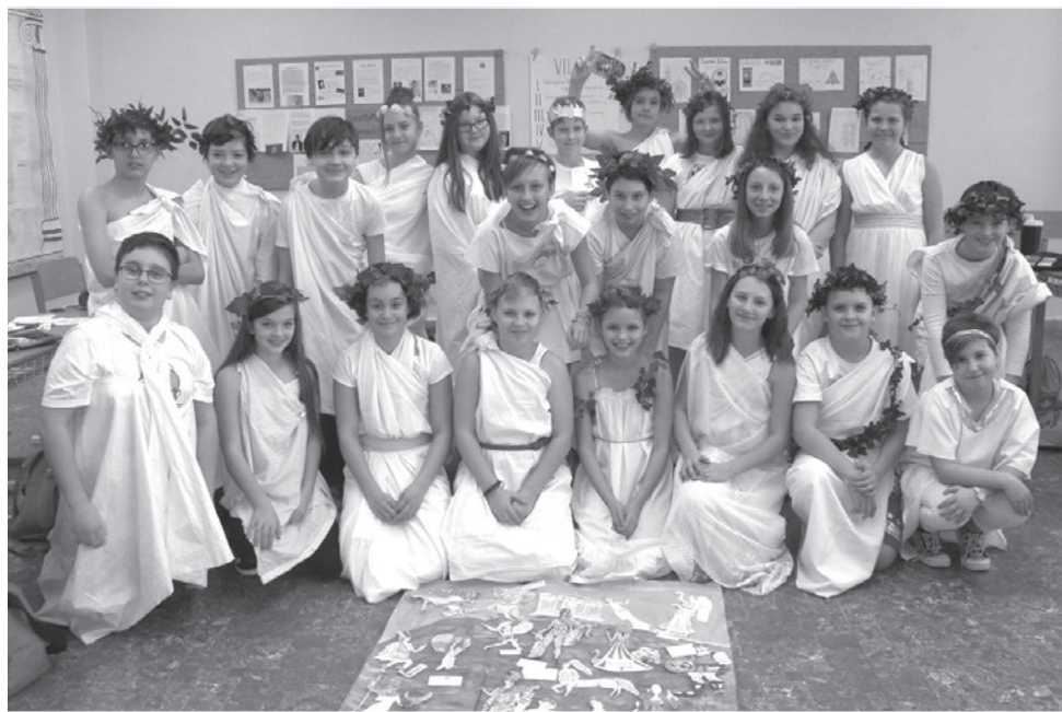
Projekt Řecko a bohové byl vskutku plný nevšedních zážitků a děti se spokojeně usmívaly.