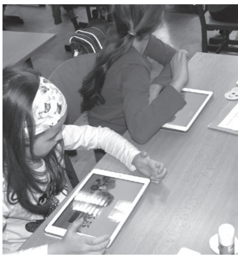
Malí druháci využili při práci na projektu i nejmodernější školní pomůcky.

Dramatizací sportovních aktivit si děti našly mezi sebou kamarády, se kterými by chtěly trávit volný čas. Děti zjistily, že také pravidelný pohyb s kamarády patří k zdravému životnímu stylu. Druhákům se projekt velice líbil a věříme, že si kromě zábavy děti odnesly i důležité znalosti týkající se zdraví, zdravého jídla a přiměřeného pohybu.