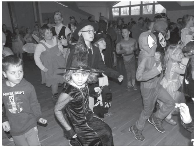
Rej masek byl opravdu veselý...

Závěrem proběhla všemi toužebně očekávaná tombola, zvířátka z nafukovacích balónek a rej s obrovským nafukovacím míčem. Domů ze sálu odcházely masky nadšené a spokojené a některé už i tak vytančovány, že už ani nebylo poznat, co vlastně představují. Poděkování patří Klubu rodičů za finanční zajištění celé akce.