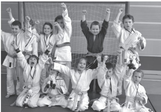
Doberští benjamínci byli nejúspěšnějším týmem na turnaji v Karviné

Hledáme další talenty. Každé úterý a čtvrtek od 16,30 v tělocvičně základní školy. Školka a družina v úterý od 14,15 hod.