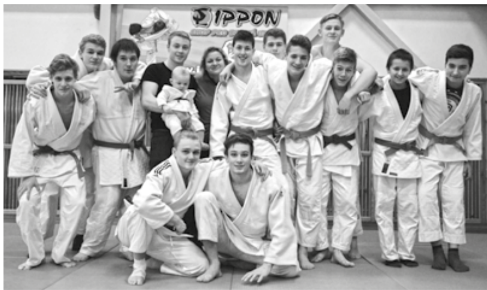
Kolektiv dorostenců vybojoval stříbro v prestižní dorostenecké lize.

Přejeme všem sportovcům a občanům Dobré krásné vánoce a úspěšný rok 2017.