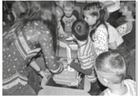
Slabikář je sice super, ale nic se nevyrovná sladkému dortu.