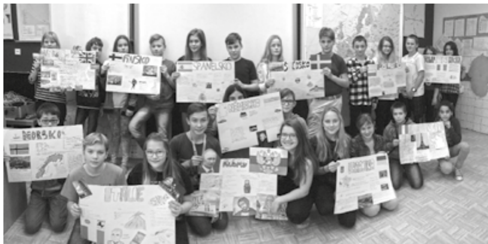
Seadmáci vyrobili svým státům krásné plakáty a zdařile prezentovali zjištěné informace.

V předposledním listopadovém týdnu výuku sedmých tříd zpříjemnil oblíbený projekt Evropa zaměřený na poznávání evropských zemí z hlediska zeměpisu, kul- tury, historie či významných osobností.