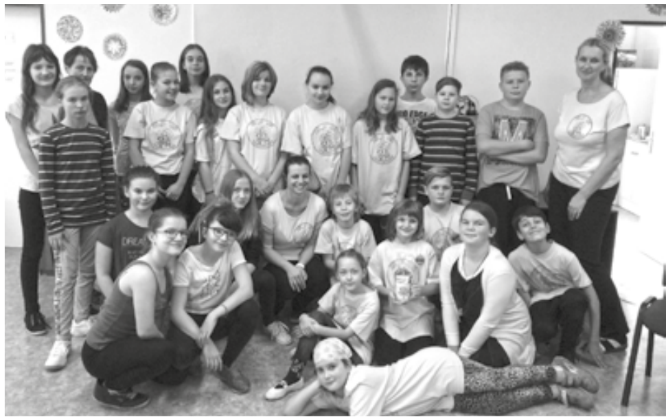
Raškovickej a doberskej ekotým na společném setkání.