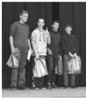
Úspěšné družstvo devátáků se raduje z úspěchu na soutěži Náboj junior.

V pátek 25. 11. se konala ve Frýdlantě nad Ostravicí mezinárodní matematicko-