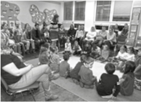
Rodiče mohli být na své prvňáčky právem hrdí.