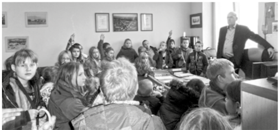
Děti si připravily pro pana starostu řadu otázek.