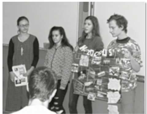
Devátáci vyrobili na téma holocaustu pozoruhodné informační plakáty.

Každým rokem si s žáky devátého ročníku v rámci výuky historie 2. světové války připomínáme hrůzy nacistického holocaustu. Také letos si žáci připravovali v hodinách dějepisu informační plakát, aby se lépe seznámili s touto děsivou tragédií dějin. Devátáci se seznámili se základními pojmy, které souvisejí s tematikou holocaustu a také zpracovávali životní příběh konkrétní oběti holocaustu z řad českých občanů židovského původu. Svoji práci pak prezentovali v jednom ze tří projektových dnů, které jsme tématu na naší škole věnovali.