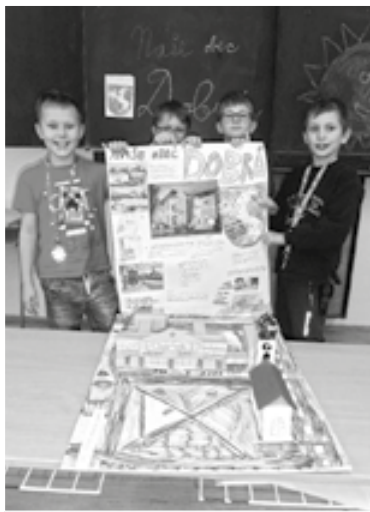
Třetáci se při výrobě informačních plakátů o naší obci velice snažili a výsledky stály za to.

A protože by děti měly vědět, že naši obec nám pomáhají chránit i jednotlivé složky Integrovaného záchranného systému v Nošovicích, vydali jsme se tam pěšky na exkurzi. Děti měly možnost zhlédnout techniku a vybavení hasičů i policistů a dozvědět se mnoho zajímavého o jejich práci. Dokonce si samy