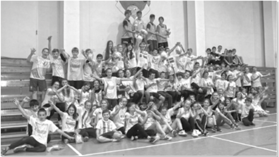
Děti ve vlastnoručně vyrobených dresech jen zářily a s nadšením si užívaly sportovní soutěže.