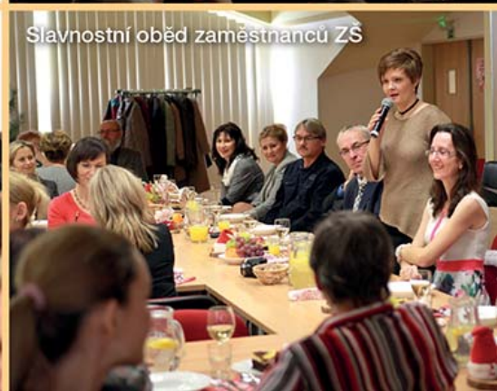
Slavnostní oběd zaměstnanců ZŠ