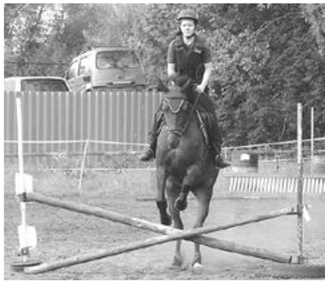
Oddílové závody – křížkový parkur

jen několika menších závodů. Vyzdvihnout je snad možné účast naší čerstvě obsednuté kobylky Bedrunky na zkoušce tříletých klisen, kde se předvedla velmi nadějně. Opět jsme zopakovali oddílové závody, na kterých si i ti nejmenší a nejméně zkušenější členové mohli vyzkoušet závodní atmosféru např. v jízdě zručnosti. Ti zkušenější změřili své síly v drezurní úloze a parkuru. Soutěžící přijeli podpořit jejich rodiče i známí, a tak byla atmosféra perfektní.