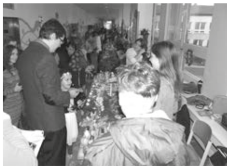
... a zákazníci se jen hrnuli.

Pro milovníky umění si naši žáci nacvičili vánoční představení Vánoční koleda na motivy stejnojmenné knihy Charlese Dic-