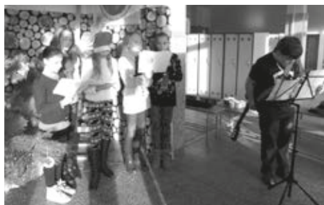
Naše vzácné hosty vítal u vstupu do školy koledami malý pěvecký sbor.

Na chodbách školy se konal vánoční jarmark, kde si mohli zájemci u stánků jednotlivých tříd zakoupit krásné výrobky našich žáků. K prodeji byly i vynikající koláče z naší školní kuchyně a ozdobná keramika ze školní keramické dílny. Ve třídách a odborných učebnách probíhal doprovodný program připravený našimi vyučujícími, hosté si tak měli možnost vyzkoušet všechny pomůcky, které děti ve vyučování používají, zejména pak moderní techniku v podobě interaktiv-