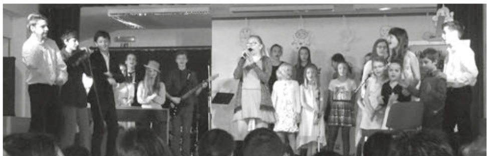
Vystoupení našich dětí dojala publikum k slzám.