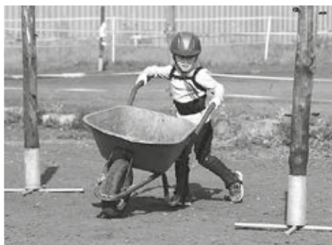
Oddílové závody – jízda zručnosti