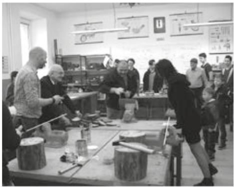
Řezání dřeva na rychlost si ve školní dílně vyzkoušeli i mnozí rodiče.

Děkujeme všem našim milým hostům, že se rozhodli prožít předvánoční sobotní odpoledne právě v naší škole, a přejeme si,