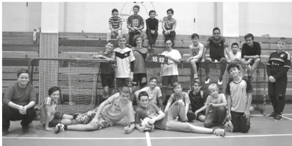
Ani v předvánočním shonu si milovníci fotbalu nenechali vzít svoji herní vášeň.