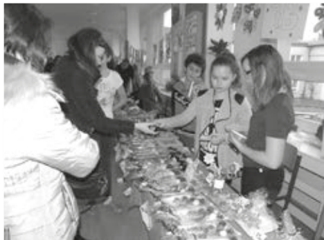
Stánky jednotlivých tříd nabízely široký vánoční sortiment ...

Pro milovníky umění si naši žáci nacvičili vánoční představení Vánoční koleda na motivy stejnojmenné knihy Charlese Dic-