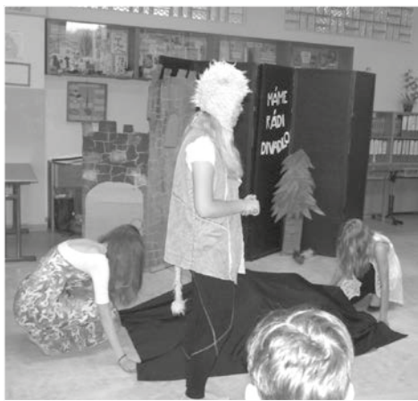
K počtě památky Karla IV. zavítal do školy i pravý český lev.

Překvapením určitě byla nevšední historická dramatizace pod názvem Toulky s českým lvem, kterou si i s hudebním doprovodem připravila děvčata ze tříd 8. B a 6. A. Nesměly chybět ani aktivity zaměřené na