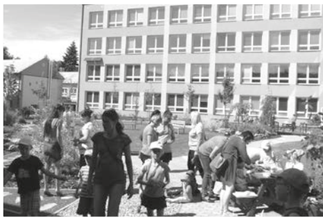
Školní atrium přivítalo ve slunném odpoledni řadu hostů z řad doberských občanů.

Jsmo rádi, že se tato akce návštěvníkům z řad občanů obce Dobrá i širokého okolí