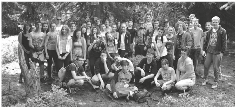
Vrcholová fotografie z Velkého Travného.