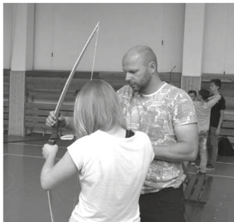
Děti si během dne s Karlem IV. mohly vyzkoušet i historickou lukostřelbu.

vynikající jazykovou vybavenost císaře Karla IV., matematické oříšky, historické úlohy a vynálezy této doby.