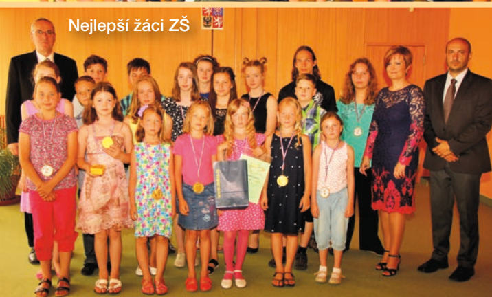
Nejlepší žáci ZŠ