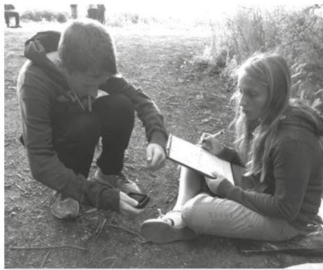
Terénní zeměpisná praxe naučila děti práci s GPS navigací.

Druhý den, jehož součástí byla i terénní zeměpisná praxe, žáci prožili na myslivecké chatě a v přilehlém lese. Na chatě