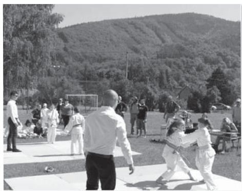
Mistrovství klubu se uskutečnilo pod širým nebem.

nasazením a touhou po vítězství domácí základna z Raškovic. Ve třetím a čtvrtém kole ve velmi vyrovnaném stavu vítězí opět základna Frýdku Místku. Tým Dobré, oslabený o své opory skončil těsně na třetím místě.