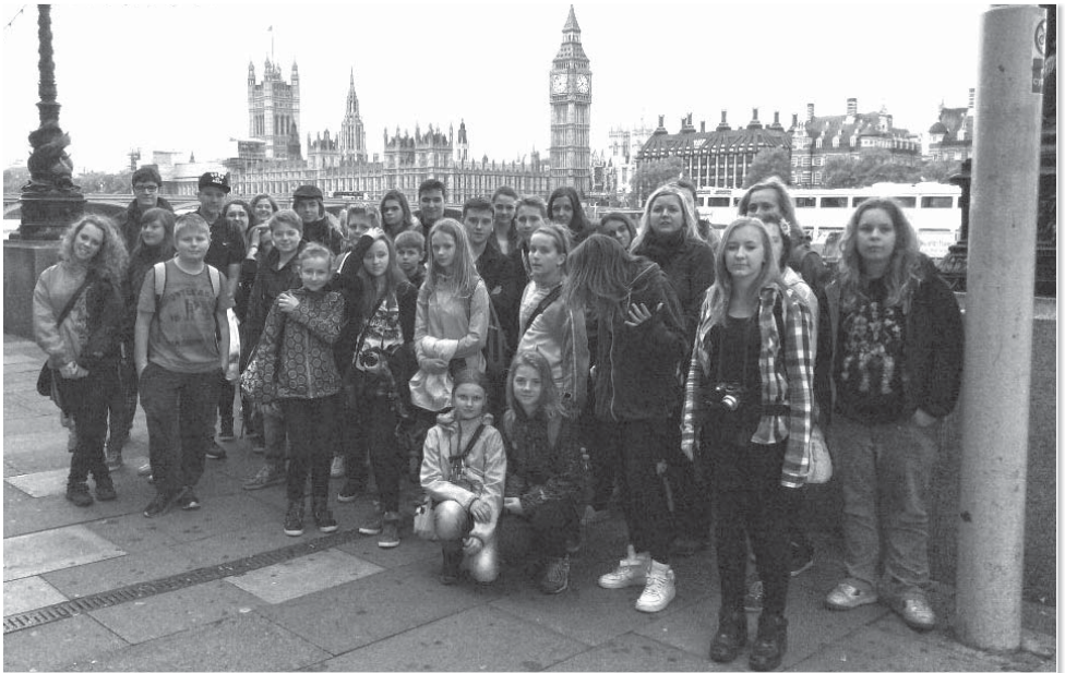
Město na Temži nás uvítalo jako staré známé vznešenými tóny zvonu Big Ben.

Brzy dopoledne jsme už vystupovali nedaleko budov Parlamentu a kochali se melancholickým vyzváněním Big Benu. Po prohlídce centra města, kdy jsme mj. viděli vojenskou přehlídku u královna sídla v Buckinghamském paláci, jsme došli na Trafalgar Square a mohli nahlédnout do obrazových sbírek Národní galerie. Vidět slavné van Goghovy Slunečnice se člověku nepodaří každý den. Také jsme si zašli do Britského muzea, kde je možno spatřit