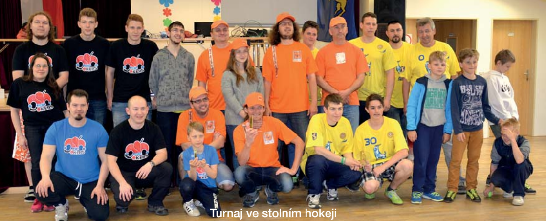
Turnaj ve stolním hokeji