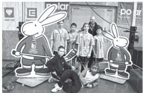
Naši florbalisté s Bobem a Bobkem, jakýs takýs klobouk má ovšem jen brankář.

Po čtvrté ve své historii naše škola postoupila na největší florbalový turnaj v České republice. Kvůli MS světa v hokeji, které se hrálo v ČEZ aréně, se letos netradičně