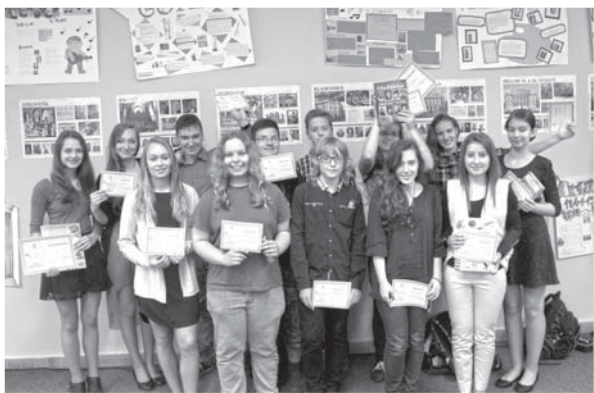
Spokojení účastníci soutěže v mluveném projevu Verbalista 2015.