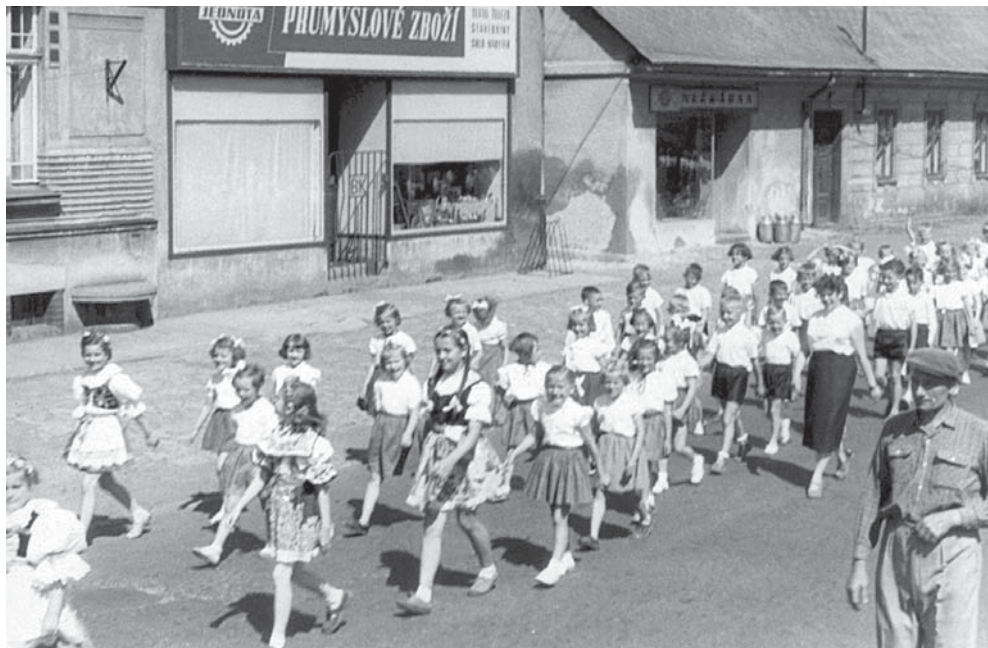
Spartakiádní průvod dětí v květnu 1960.