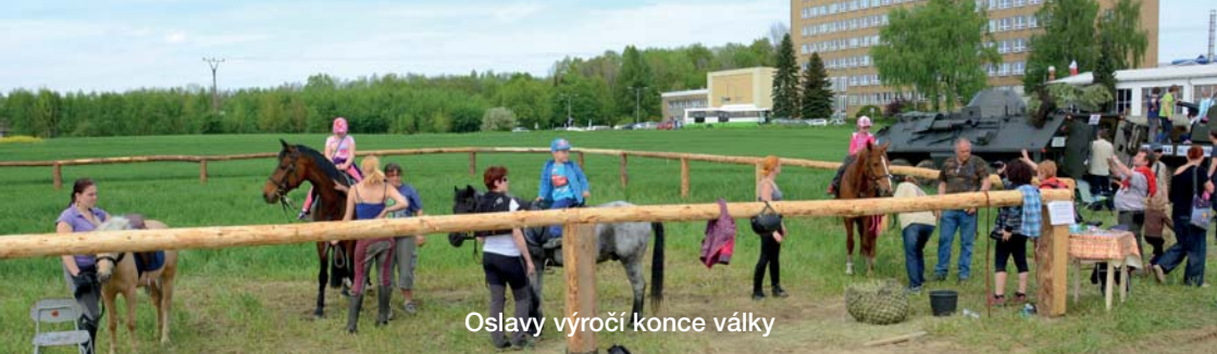
Oslavy výročí konce války