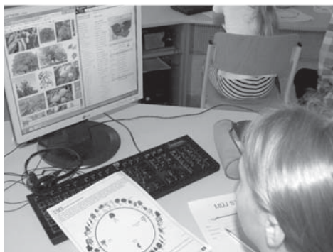
V počítačové učebně děti hledaly zajímavé informace týkající se stromů.

a jehličnaté stromy. Nakreslili si jejich kůru, zahráli hru hmatavku, při níž hledali stromy se zavázanýma očima. V lesní hrabance hledali živočichy a určovali je, také si prohlédli obávaného škůdce dřevin – lýkožrouta smrkového a severního.