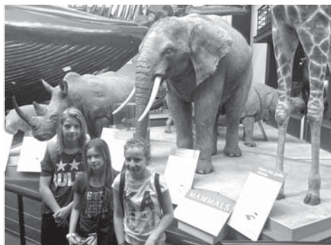
Přírodovědné muzeum nás nadchlo svými exponáty ze všech oblastí živé i neživé přírody.

Ve čtvrtek se obloha zamračila a my jsme si tak užili opravdového anglického počasí – několik druhů deště a navrch silný vítr od moře. Přesto jsme neztráceli dobrou