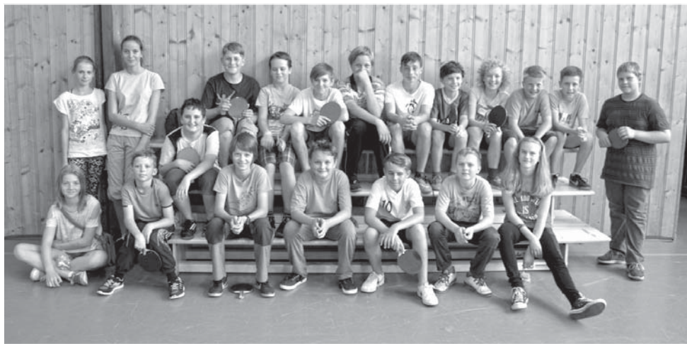
Účastníci turnaje ve stolním tenisu si užili krásné odpoledne naplněné ping-pongovou pohodou.