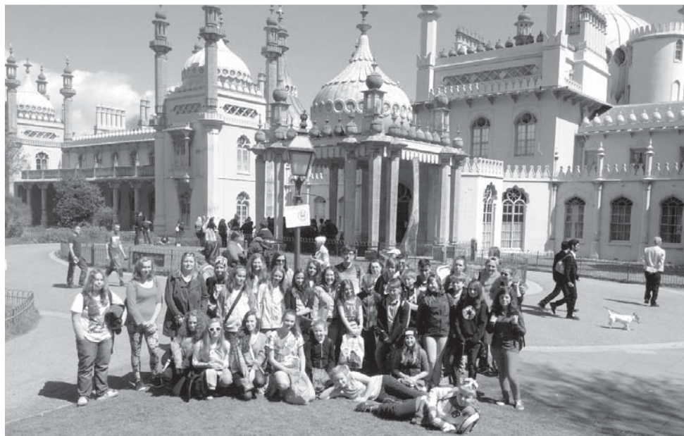
Ne, nejsme v Bagdádu na dvoře Hárúna ar-Rašída, ale před palácem Royal Pavilion v Brightonu.

zázraky starověkého umění několika kontinentů. Ale to už byl večer a tedy čas odebrat se do hostitelských rodin, kde jsme povečeřeli a odebrali se zaslouženě na kutě.