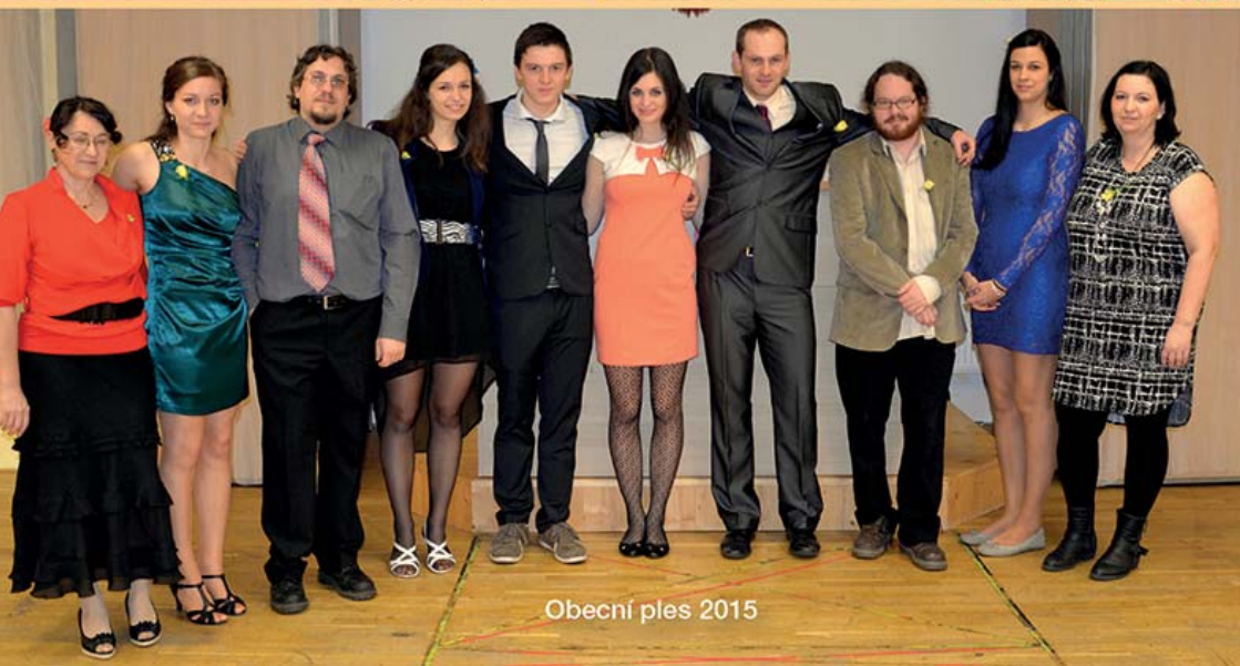
Obecní ples 2015