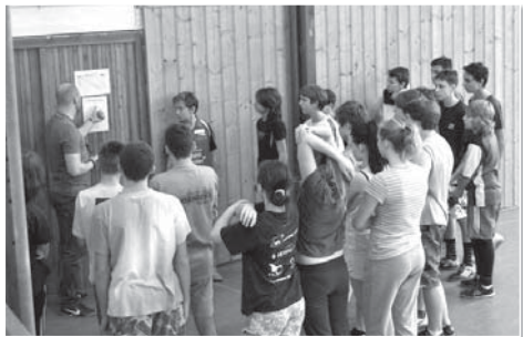
Taktická porada před turnajovým pavoukem.