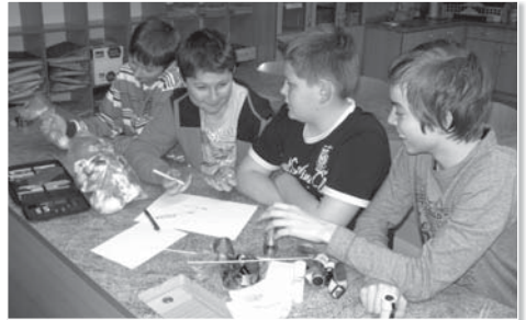
Děti daly hlavy dohromady a zachraňovaly vejce.

Ještě před spaním jsme v tichu za světla baterek prošli labyrintem kvízových otázek, kde už někomu docházely síly. Filmem Výbuch bude v pět jsme celý program zakončili a šli spát do učebny hudební výchovy. Výtečnou snídani nám připravily paní kuchařky ve školní jídelně.