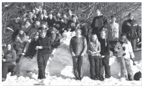
Letošní lyžařský kurz absolvovalo na třicet nadšených lyžníků. Jen Krakonoš chyběl.

V pondělí 9. února jsme odjeli do Ski areálu Opálená na Čeladné a žáci se rozdělil