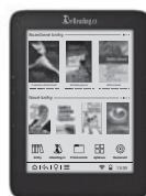
e-ink čtečky eReading.cz START 2 a 3