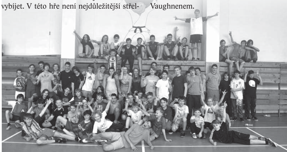
Účastníci dodgeballového turnaje si sportovní zápolení náležitě užili.

ba jako u klasické vybíjené, ale důležitější je chytání míče. Celá hra je inspirována americkým filmem Vybíjená z roku 2004 v hlavních rolích s Benem Stilerem a Vincentem Vaughnenem.