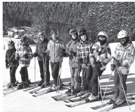
Lyžařský výcvikový kurz byl prosluněn nejen horským sluníčkem, ale také úsměvy všech účastníků.

do čtyř výkonnostních skupin. Ti zkušenější se mohli společně se svými instruktory hned vydat na svah, začátečníci se pak seznamovali se základy lyžování. Na stejném místě jsme prožili i úterní dopoledne a s potěšením jsme sledovali, jak se děti rychle učí.