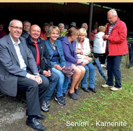
Seniři - Kamenité