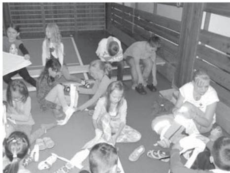
Během nácviku obvazových technik to místy v tělocvičně vypadalo jako při natáčení filmu Mumie.