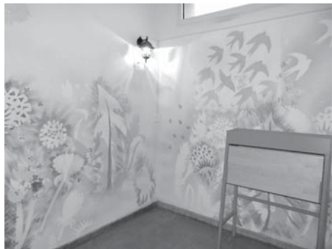
Chodba u 5. tříd dýchá přírodní lyrikou.

ství. Ruku v ruce s tímto projektem jde vzdělávání pedagogů, a proto jsme se zapojili do úspěšného projektu „Sdílím, sdílíš, sdílíme – aneb využití ICT pro efektivnější výuku“ v rámci OP VK a 16 pedagogů školy bude