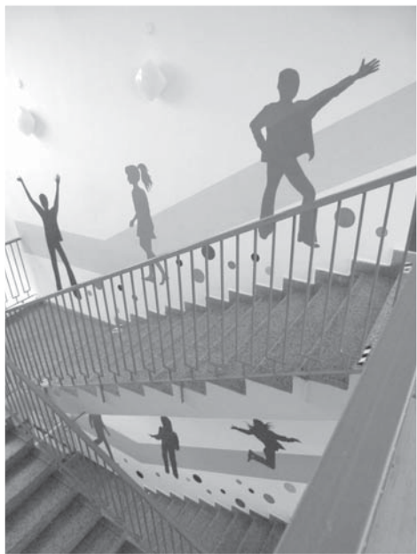
Schodiště roztančily barevné postavy.

Předně byla naše škola úspěšná ve výzvě Regionální rady regionu soudržnosti Moravskoslezsko zaměřené na Modernizaci výuky na základních školách, díky které nakoupíme 30 ks iPadů pro výuku, interaktivní tabuli, 10 ks GPS navigací a další příslušen-