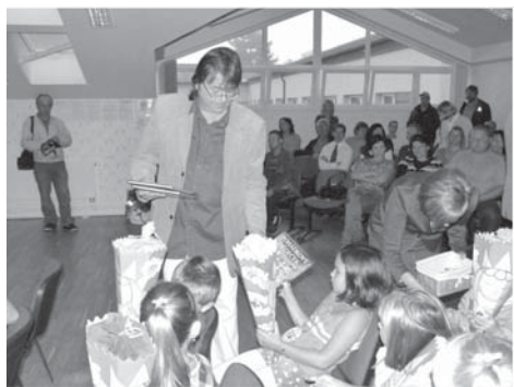
Pan místostarosta se dětem představil coby pohádkový dědeček.

První den ve škole byli prvňáčci přivítáni v multifunkčním sále naší školy. Děti ihned po příchodu dostaly od svých p. učitelek papírovou medaili s označením třídy a usadily se před kamarády Krtka a Čmeldu, kteří je budou celý školní rok provázet učením.