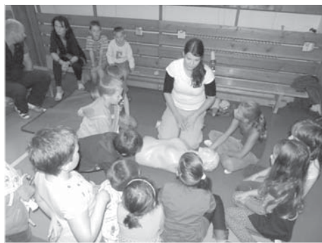
Na nově zakoupené figuríně se děti učily, jak správně provádět resuscitaci.

záchranáři nakoupili resuscitační figurínu Adam, Prestan Professional AED trenér pro nácvik záchranných technik, lékárníčku pro 10 osob, fonendoskop, brýle „opilý a nebezpečný“, noční brýle „opilý a zmatený“, obvazový a fixační materiál, deskové hry k dopravní výchově atd. Všechny tyto pomůcky využijeme v projektových dnech zaměřených na dopravní výchovu a první pomoc.