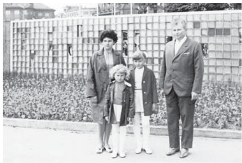
S rodinou, rok 1969