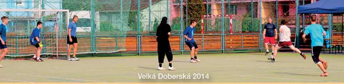
Velká Doberská 2014