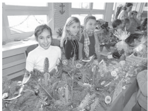
„Kupte si, paní, druhý takový svícen neseženete.“

V sobotu 14. prosince děly se ve škole věci nevídané. Hned tři veliké a divuplné události přilákaly zástupy vánočních poutníků všech generací zblízka i zdáli – Den otevřených dveří, Vánoční jarmark a Vánoční koncert změnilo na jedno dopoledne Základní školu v Dobré na kulturní centrum srovnatelné v myslích lidí dobré vůle s Goethovým Výmarem.