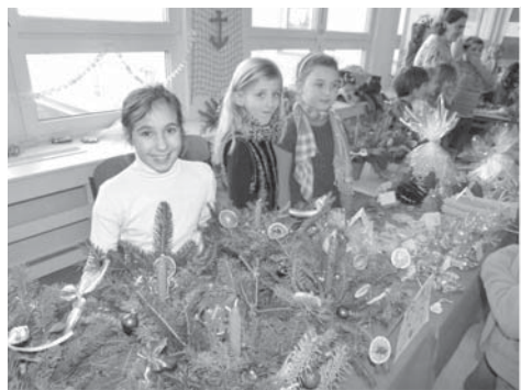
„Kupte si, paní, druhý takový svícen neseženete.“

V sobotu 14. prosince děly se ve škole věci nevídané. Hned tři veliké a divuplné události přilákaly zástupy vánočních poutníků všech generací zblízka i zdáli – Den otevřených dveří, Vánoční jarmark a Vánoční koncert změnilo na jedno dopoledne Základní školu v Dobré na kulturní centrum srovnatelné v myslích lidí dobré vůle s Goethovým Výmarem.