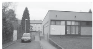
Budova Centra ve Frýdku-Místku