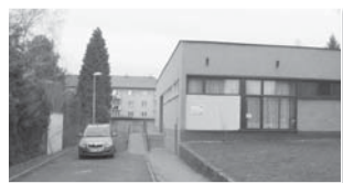
Budova Centra ve Frýdku-Místku