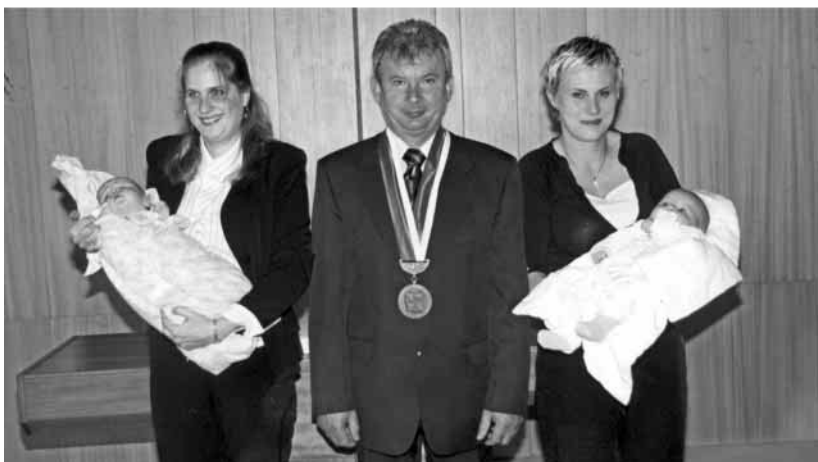
Vítání občánků — obrázek k textu na straně 3.