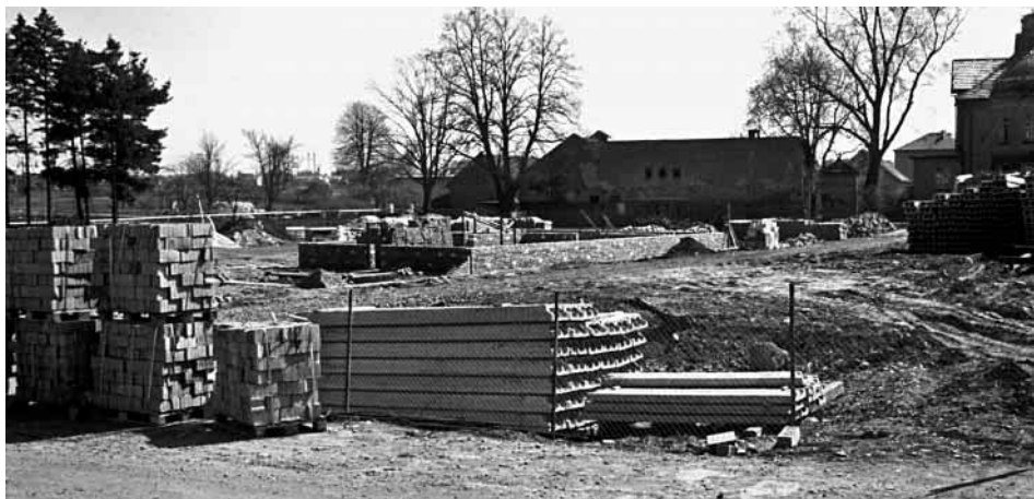
Největší stavba v akci „Z“ — integrovaný dům služeb. Tak se začínalo... (Zima 1986.)

Sto poslanců a deset občanských výborů z jednotlivých obcí plnilo úkoly místního národního výboru s rozšířenou působností, jak ve státní správě, tak samosprávě a podílelo se na plnění volebního programu Národní fronty. Na různých tehdejších akcích „Z“ odpracovali mnoho brigádnických hodin na investičních a neinvestičních stavbách ve prospěch rozvoje okolních obcí.