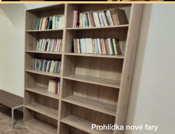
Prohlídka nové fary