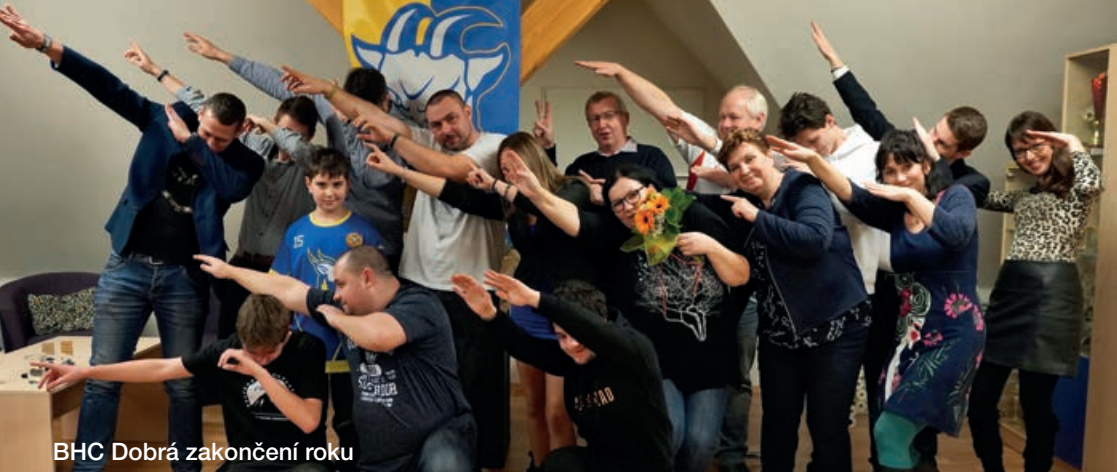
BHC Dobrá zakončení roku