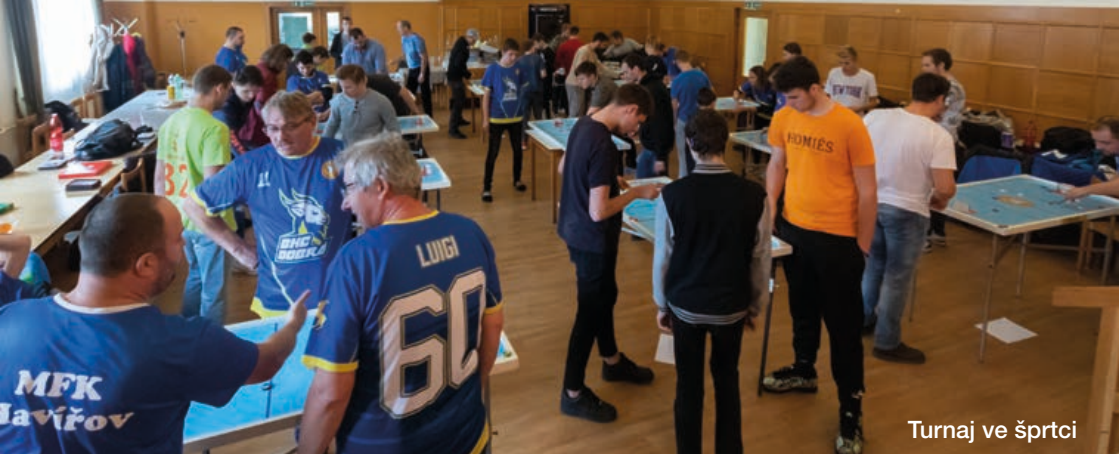
Turnaj ve šprtci