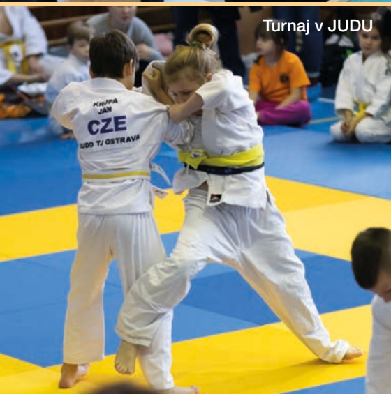
Turnaj v JUDU