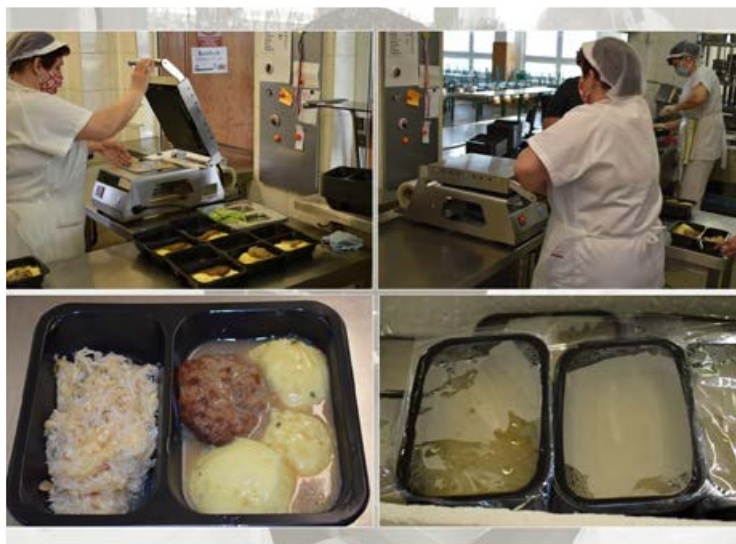
Všechny obědy uvařené v naší školní jídelně se nyní krabičkují.