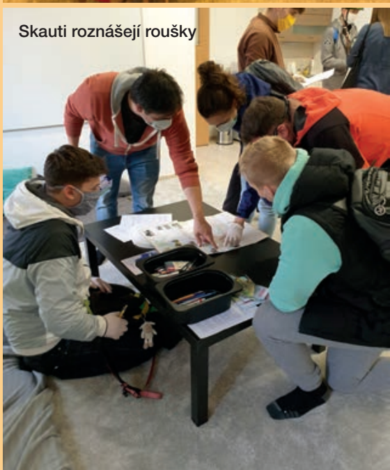
Skauti roznášejí roušky