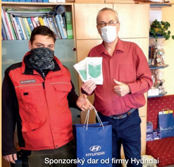
Sponzorský dar od firmy Hyundai