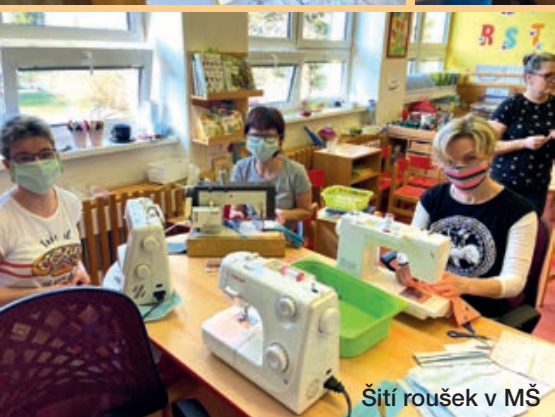
Šití roušek v MŠ