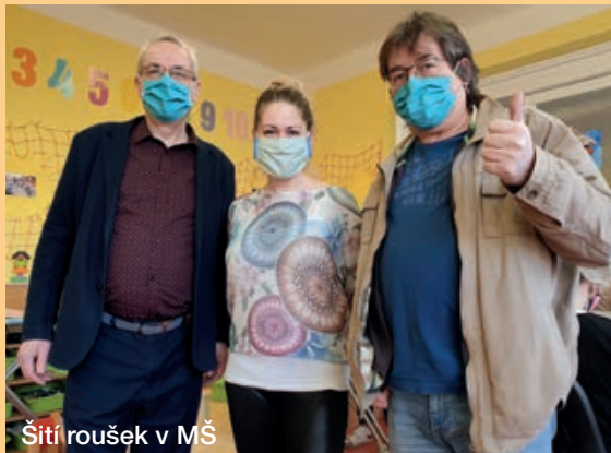
Šití roušek v MŠ