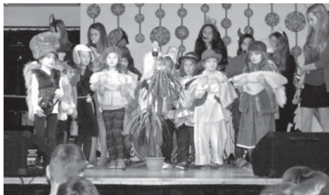
Vystoupení malých pastýřů z 1. ročníku všechny diváky dojalo.

16. prosince se konalo krajské finále v halové kopané v Bílovci. V těžké konkurenci sportovních škol se náš tým umístil na 5. místě. Družstvo z Dobré bylo bohužel oslabeno o dva hráče základní sestavy, kteří byli zranění. Žáci měli možnost si zahrát s kompletními fotbalovými týmy, které spolu hrají několik let, např. ZŠ Šoupala z Ostravy má družstvo tvořené z hráčů Baníku Ostrava.