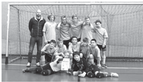
Náš tým v krajském kole dále nepostoupil, ale rozhodně nezklamal.