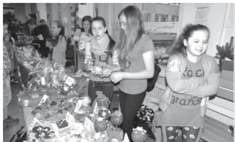
Děti nabízely své vánoční výrobky a ověřily si tak v praxi, že prodavač tvrdý chleba má.

ozdob, svícňů či cukroví lákal k útratě, zvláště když ceny byly opravdu lidové. Peníze takto vydělané si děti uloží do třídních fondů a využijí je v průběhu roku na financování svých aktivit. Osladit život si návštěvníci jarmarku mohli i vynikajícími koláči, které pekly paní kuchařky z naší školní jídelny.