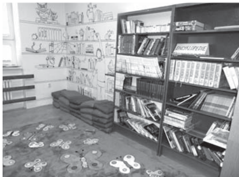
Nový čtenářský koutek ve školním infocentru je krásně vyzdoben.

Druhý projekt Čteme rádi – čteme spolu byl ve výši 30 000,- Kč podpořen Lesy České republiky, s. p. Jeho cílem je aktualizovat v současné době zastaralý knižní fond školního infocentra o nové tituly, kterými