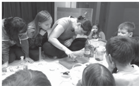
Děti si mj. užily večerní vědecko-technické pokusy. A že byly zajímavé!

Nastal opět čas Vánoc, je to doba pohody, klidu, splněných přání a kouzelných chvil. A přesně takovouto atmosféru zažily děti ze třídy 3. A, které strávily „Kouzelnou předvánoční noc“ ve škole.