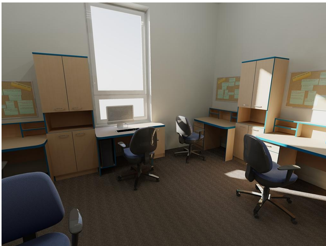
Obr. č. 2: Kabinetu učitelů 2. NP