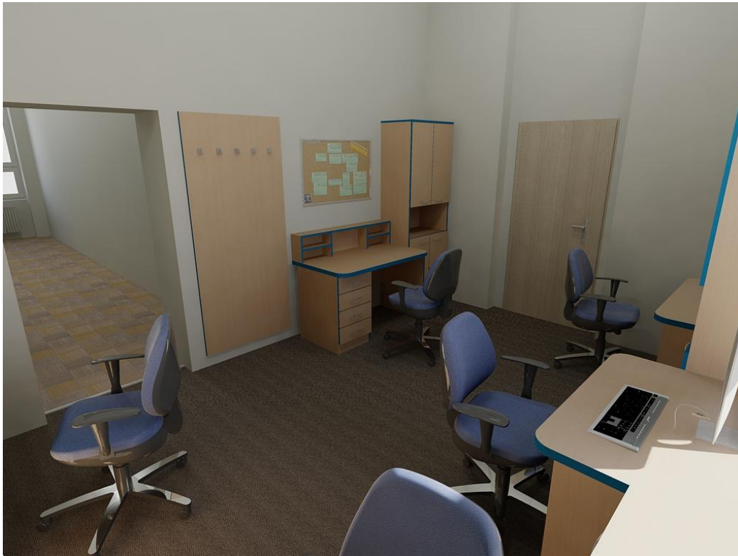
Obr. č. 1: Kabinetu učitelů 2. NP