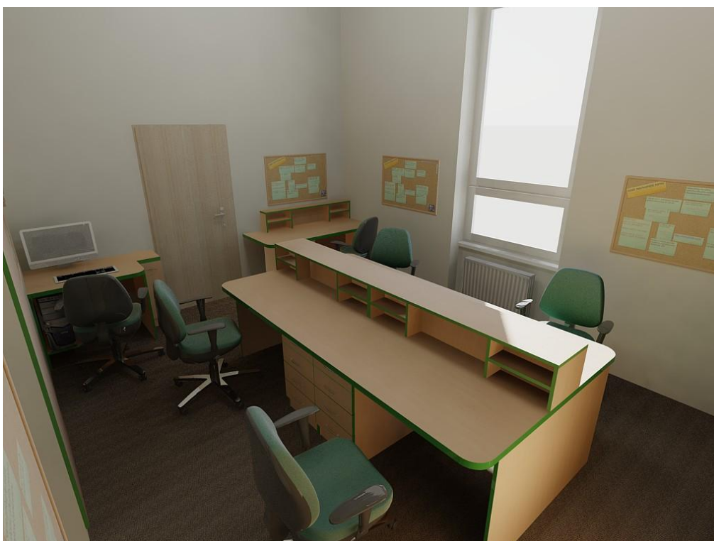
Obr. č. 5: Kabinet učitelů 3. NP