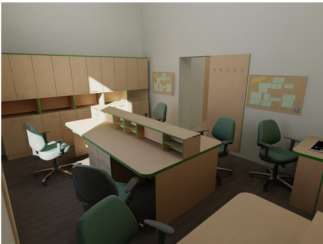
Obr. č. 4: Kabinet učitelů 3. NP