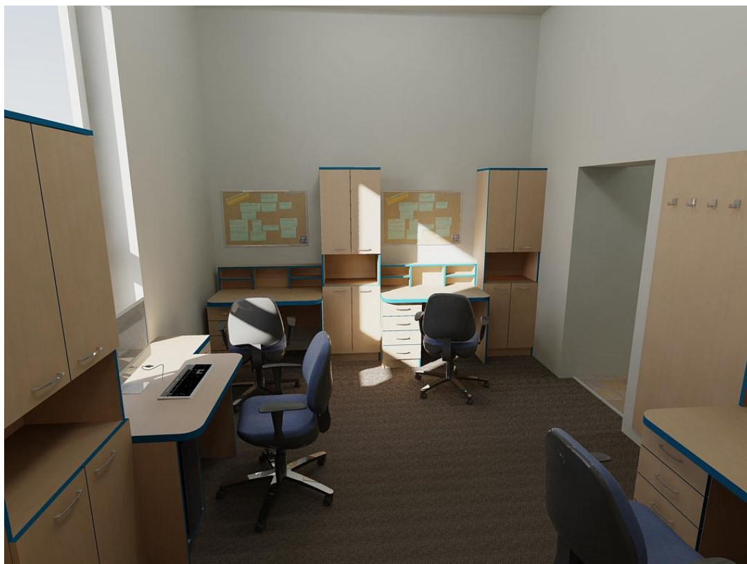
Obr. č. 3: Kabinet učitelů 2. NP