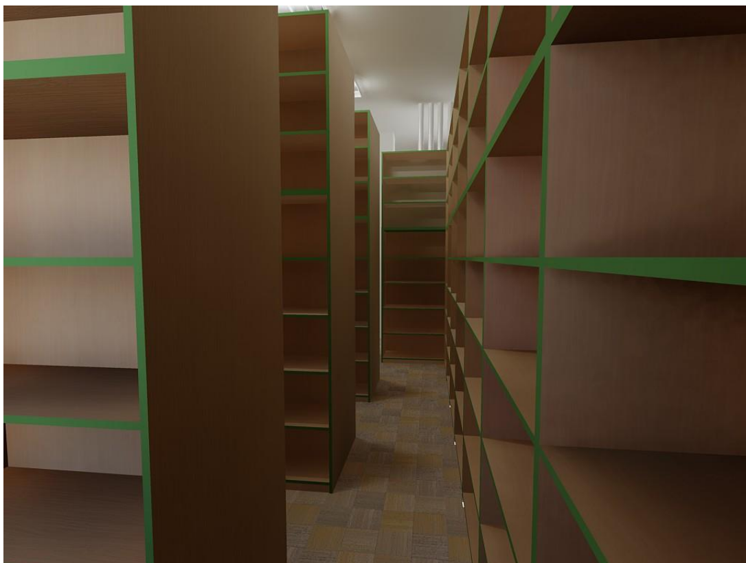
Obr. č. 6: Přilehlý sklad 3. NP